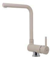
MGKDAN51 G51 8031873101817