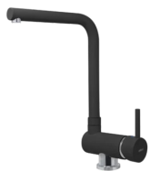
MGKDAN40 G40 8031873101831