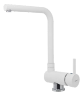
MGKDAN68 G68 8031873101824