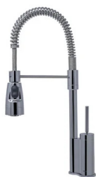
MIKCHECR CR 8031873650575