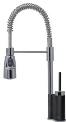
MGKCHE40 G40 8031873103231