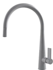
MMKATP79 M79 8031873551582