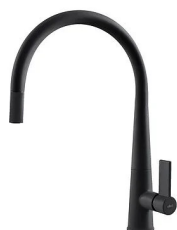
MGKATP40 G40 8031873104467