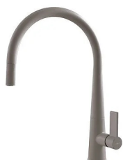
MGKATP43 G43 8031873104481