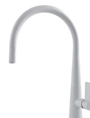
MGKATP68 G68 8031873104498