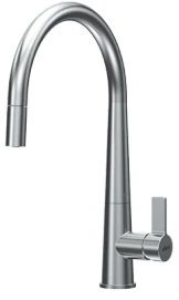
MIKATPCR CR 8031873651824