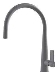
MGKATP48 G48 8031873104474