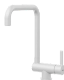
MGKDAN68 G68 8031873101824