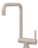
MGKDAN51 G51 8031873101817