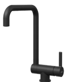
MGKDAN40 G40 8031873101831