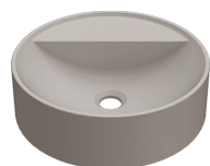
BDPUT40RCA DCA 8031873010805