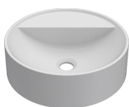
BDPUT40RWH DWH 8031873764197