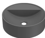
BDPUT40RGR DGR 8031873764203