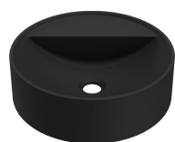
BDPUT40RBK DBK 8031873764180