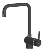
MGKSEN40 G40 8031873101008