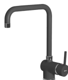
MGKSEN59 G59 8032861108641