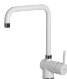
MGKSEN68 G68 8031873100896