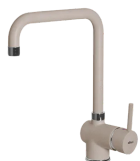
MGKSEN51 G51 8032861108580