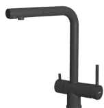
MGKTOP40 G40 8031873005061