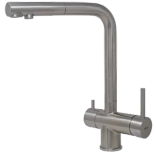
MIKTOPIN IN 8031873005092