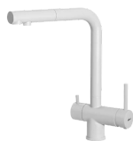
MKKTOP96 K96 8031873005115