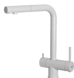
MGKTOP68 G68 8031873005085