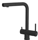
MKKTOP86 K86 8031873005108