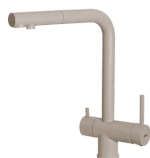
MGKTOP51 G51 8031873005078